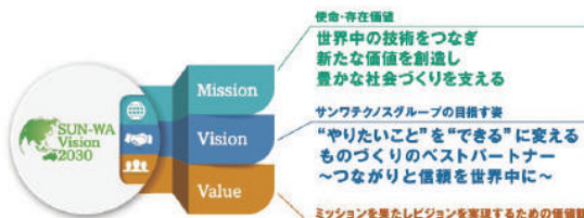
長期ビジョン Sun-Wa Vision 2030